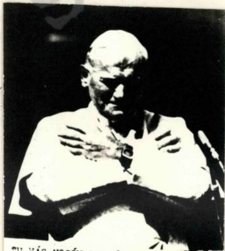
TU VÁS NOSÍM, DRAHÍ CHORÍ SLOVENSKA