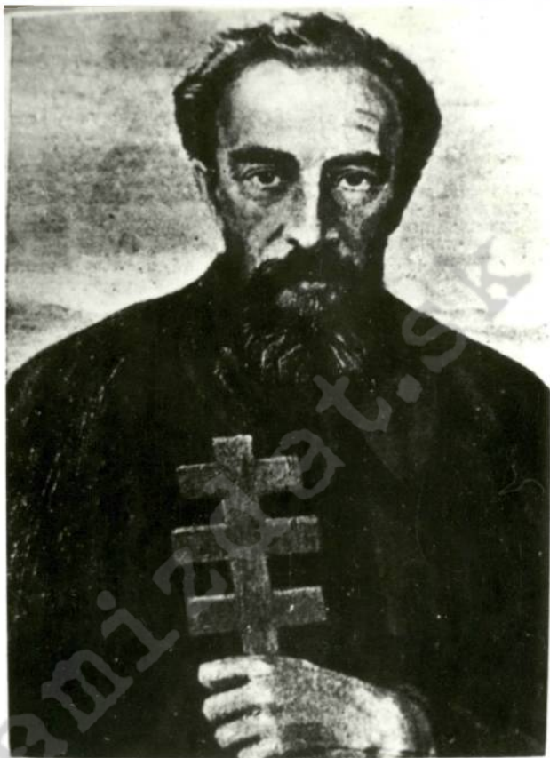
о. Леонидъ Федоровъ

• 4. XI. 1879 † 7. III. 1935. Экзархъ Русской Католической Церкви восточнаго обряда.