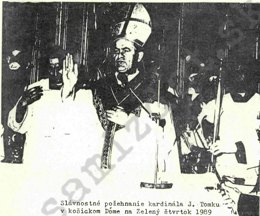
Slávnostné požehnanie kardinála J. Tomku v košickom Dóme na Zelený štvrtok 1989

Účastníci seminára poslali zo stretnutia listy kardinálovi J. Tomkovi a biskupovi J. CH. Korcovi; uverejňujeme ich v plnom znení.